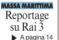
► A pagina 14