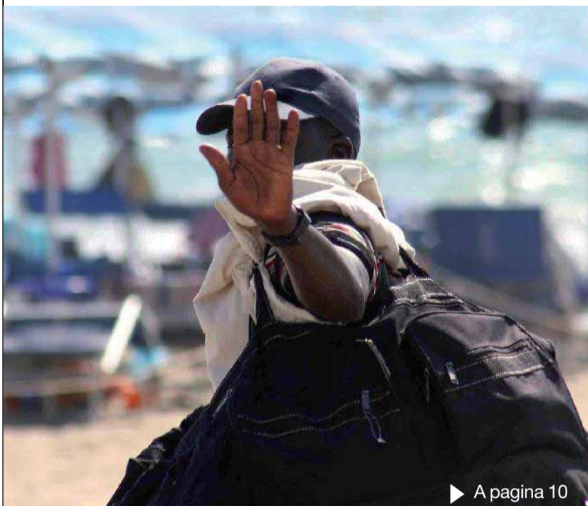
► A pagina 10

Castiglione Controllati 20 ambulanti: 10mila euro di multa Vigilessa in incognito incastra i vu' cumpra