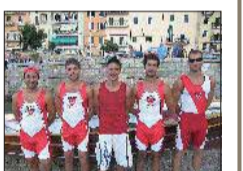
► A pagina 15

MONTE ARGENTARIO La Croce vuole il Palietto