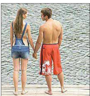
Viaggi Vacanze d'amore

Aumentano le richieste per i viaggi in solitario I single maremmani cercano l'amore in vacanza